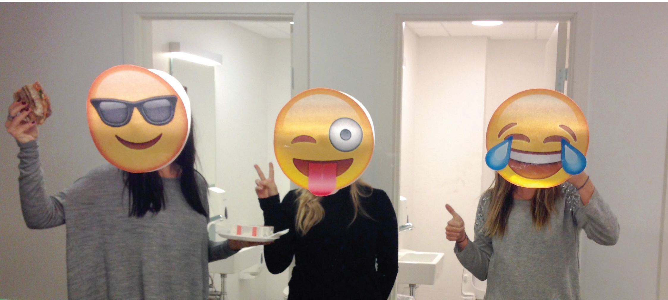
KLISTERMÆRKER TIL SPEJLE